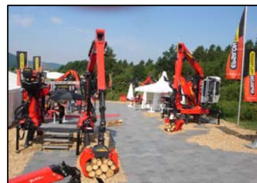
Luftaufnahme EPSILON Stand KWF-Tagung 2008

Nach der erfolgreichen Einführung der OFF ROAD Kranreihe auf der Interforst 2006, findet nun mit der neuen EPSOLUTION Krangeneration eine Fortsetzung statt. Erfahrungen aus der seit acht Jahren am Markt bestehenden ON ROAD Kranreihe, Highlights aus der OFF ROAD Reihe sowie zahlreiche Anregungen aus der Praxis fließen in die Entwicklung der neuen ON ROAD Holzladekrane und RECYCLING Krane ein.